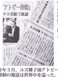
今年5月、ユズ種子油アトピー抑制の報道は世界中を巡った。

「アトピー」症状のあるマウスにユズ種子油塗布により、肥満細胞からヒスタミン放出阻害する効果がみられた。この結果はユズ種子油に、アレルギー性皮膚炎症状を緩和する働きがあることを示唆する。また、ユズ種子油の傷口摂取によるアレルギー疾患への効果についても研究を進めている。